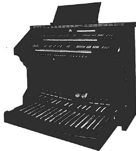
Spieltisch der Hupfeld-Orgel im Capitol Leipzig.